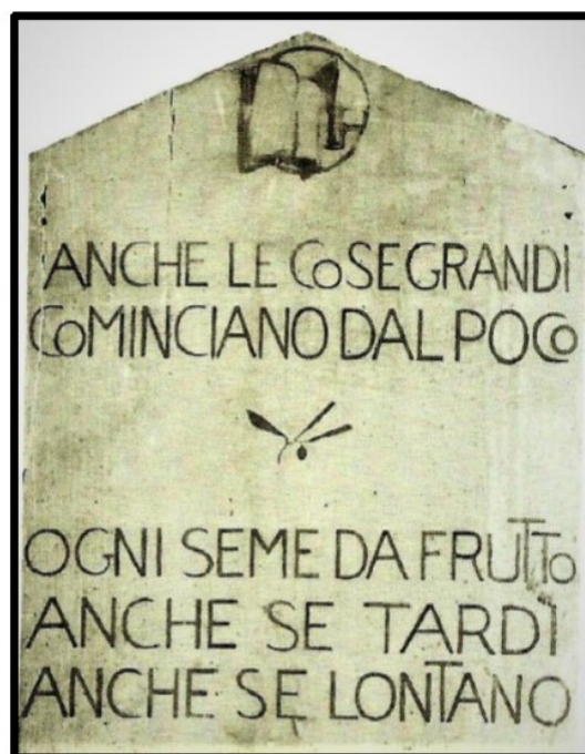
ROCCA PRIORA La "scoletta" di Colle di Fuori